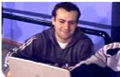
Al final no hubo ascenso para Marín "A" de Louzao.

Así las cosas, y con Torpedo Gallaecia y Universidad de Vigo-XG descartados de la pugna por la segunda plaza, la suerte de marinenses y bueuenses estaba en manos del Sonnen. Finalmente, y tras muchos cálculos se obraba el milagro. Bueu "B" se convertía en nuevo equipo de Primera al superar por no demasiado margen a Marín "A"! De esta manera tan inesperada como sorprendente, en un final de infarto, los bueuenses retornaban a la división de plata del ajedrez gallego un año después de haber consumado su descenso, mientras Marín "A" se quedaba con la miel en los labios, preso de una tremenda desilusión cuando ya se veía en Primera. Pero así son las cosas; también los milagros y situaciones más inverosímiles se dan en el mundo de la competición y hay que aceptarlos como parte del juego.