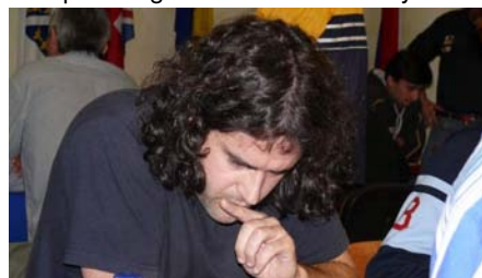
A SAFA "A" de Luis Carril no le tembló el pulso y tras vencer a Ribeira por 3-1 se convertía en nuevo equipo de División de Honor.

La dramática batalla por la permanencia se libraba en varios frentes. Uno de esos puntos neurálgicos tuvo a Lugo como escenario y a Recatelo y Alexandre Bóveda "B" por protagonistas. Los coruñeses tenían que evitar a toda costa que Caranza "B" sumase un tanto más que ellos y que Copérnico totalizase dos puntos más, para lo cual, nada mejor que solventar el compromiso venciendo por 3,5 a 0,5. Pero los lucenses no lo pusieron fácil y se llevaron un botín de tanto y medio que dejaba la salvación del filial de Alexandre Bóveda en el aire, a expensas de lo que hiciesen sus rivales directos, que casualmente, por caprichos del calendario, se enfrentaban entre sí. El triunfo de Caranza "B" por un ajustado 2,5-1,5 garantizaba la continuidad del cuadro hercúlico en Primera y condenaba a Santa María de Caranza "B" y Academia Copérnico al infierno de Segunda. Pocas veces antes un match ha provocado tanta decepción a partes iguales a vencedores y vencidos.