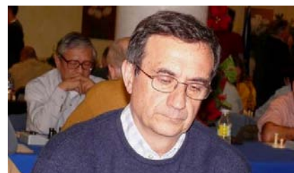
Artesanos caía al décimo lugar tras perder con Bazán, en la que fue la única ausencia liguera de uno de sus baluartes, Celestino Redondo.

A la distancia de un punto del dúo que acabamos de citar se formó un pequeño grupo compuesto por tres unidades. El Sonnen decidió que fuese la Peña Ajedrecística Ex-Alcohólicos , vencedor por 2,5-1,5 de Alexandre Bóveda "C", quien liderase dicho pelotón. El noveno puesto correspondió a Capablanca , que desaprovechó una gran oportunidad de remontar hasta la quinta plaza tras el sorprendente empate que suscribió con el colista Nuevo Club Ortigueira. El último asiento de este vagón lo ocupaba Artesanos , ampliamente derrotado por el líder por 3,5 a 0,5, tras lo cual perdía dos lugares en la clasificación hasta ubicarse en la décima posición.