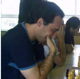
Cordido entregó el único punto de un Algalia en línea ascendente.

Algalia de Arriba parece totalmente restablecido del revés encajado el primer día a manos de Cerceda y se anotó su segunda victoria seguida por 3-1 a costa de un Santa María de Caranza "B" que por mor de este traspies desciende hasta el sexto lugar de la clasificación luego de su buen arranque.