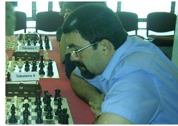
La aportación de Del Barrio ayudó al C. de las Artes a salir del pozo.

necesitado Círculo , que sin embargo no deberá aflojar el pistón si no quiere volver a verse con el agua al cuello.