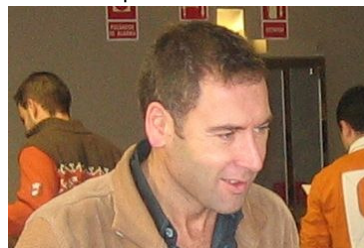
Garza dejó escapar medio punto cuando tenía cerca la victoria. Poco más fue lo que concedió un intratable Universidad Vigo a Arteixo.

tarde redonda en donde volvieron a dar muestras de su solvencia y poderío sin perder una sola partida.