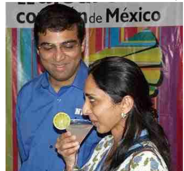
ANAND CAMPEÓN DEL MUNDO